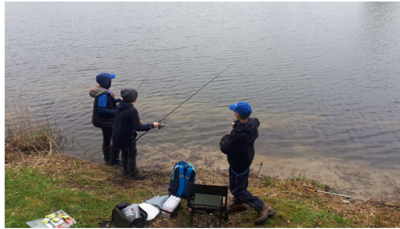
Der Angelplatz ist eingerichtet