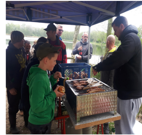
Eine kleine Stärkung durfte nicht