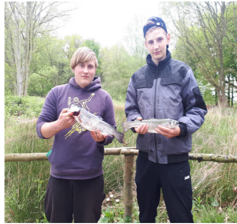
So kann es weiter gehen :-)