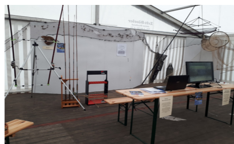
Links: warten auf den großen Ansturm, Rechts oben/unten: unser Stand