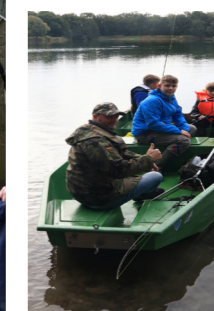
Unten rechts Bootsfahrt auf dem See