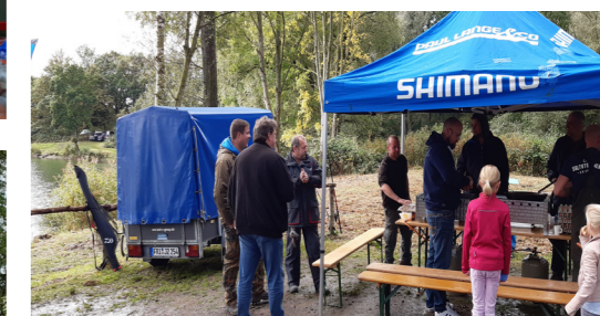
Oben links Köche bei der Arbeit