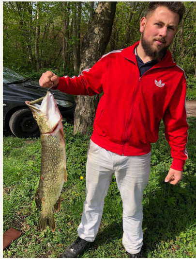
Dorian: Hecht 90 cm