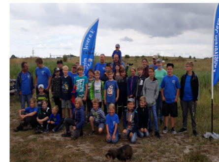
Ferienpassangeln in Böselhausen &amp; am Wangermeer 2019