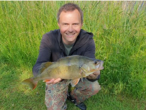
Kai: Barsch 44,5 cm