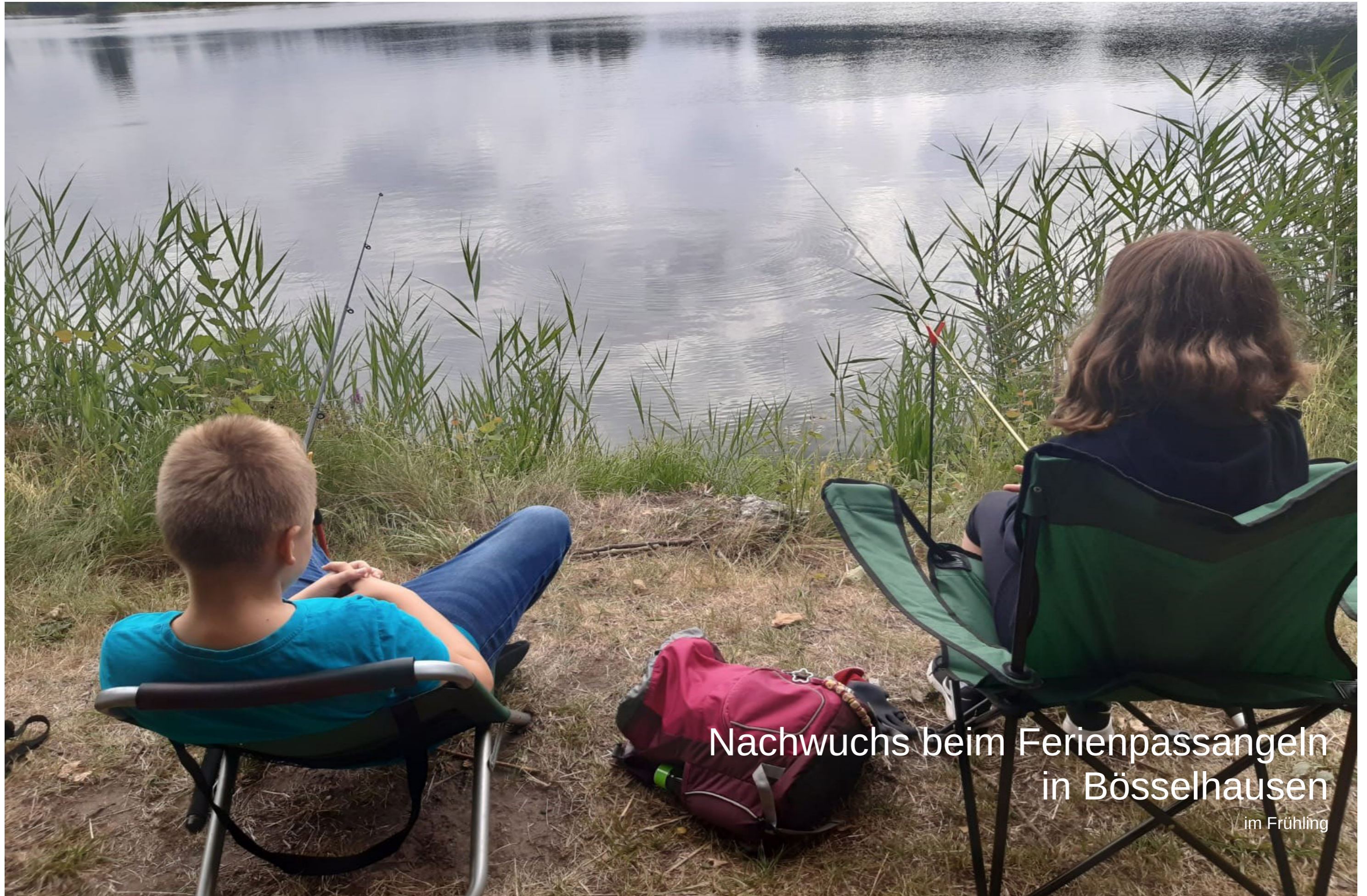
Nachwuchs beim Ferienpassangeln in Bössehausen