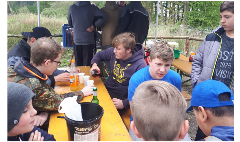
fehlen und dabei wurde viel Gefachsimpelt...