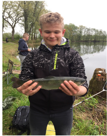
Ein toller Fang