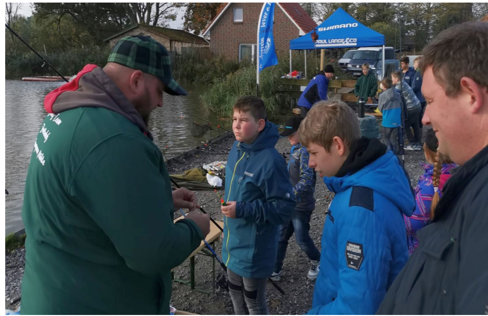
Toto beim zeigen wie man einer Montage bindet