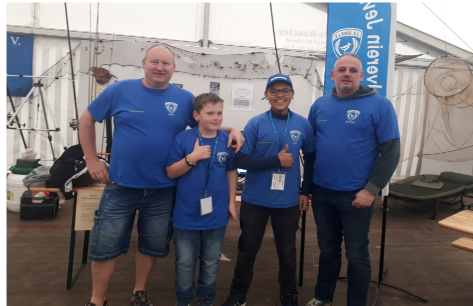
Die Jugend & Erwachsenen haben den Verein toll präsentiert