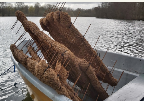
Laichbürsten noch im Boot

Einigen von euch sind sicherlich an der Sillensteder Kuhle (am Westufer) und an der Moorwarfer Kuhle (im Schongebiet) im Sommer 2020, die Plastikflaschen im Wasser aufgefallen. Hierbei handelte es sich um Markierungen für von uns geschaffene künstliche Zanderlaichplätze (Laichbürsten und Matten). Der Einsatz von Zandernester als Laichhilfe stellt eine kostengünstige als auch fischökologisch sinnvolle Maßnahme zur Unterstützung (natürlicher) vorhandener Zanderpopulationen in unseren Gewässern da. Wir haben Bereiche gewählt, die eine entsprechende Wassertiefe ab 1,5 m haben und auch bei wenig Wasser nicht trocken fallen. Durch die Markierung der Zandernester ist auch der Laicherfolg von uns kontrollierbar. Natürlich wurden diese von uns wieder entfernt.