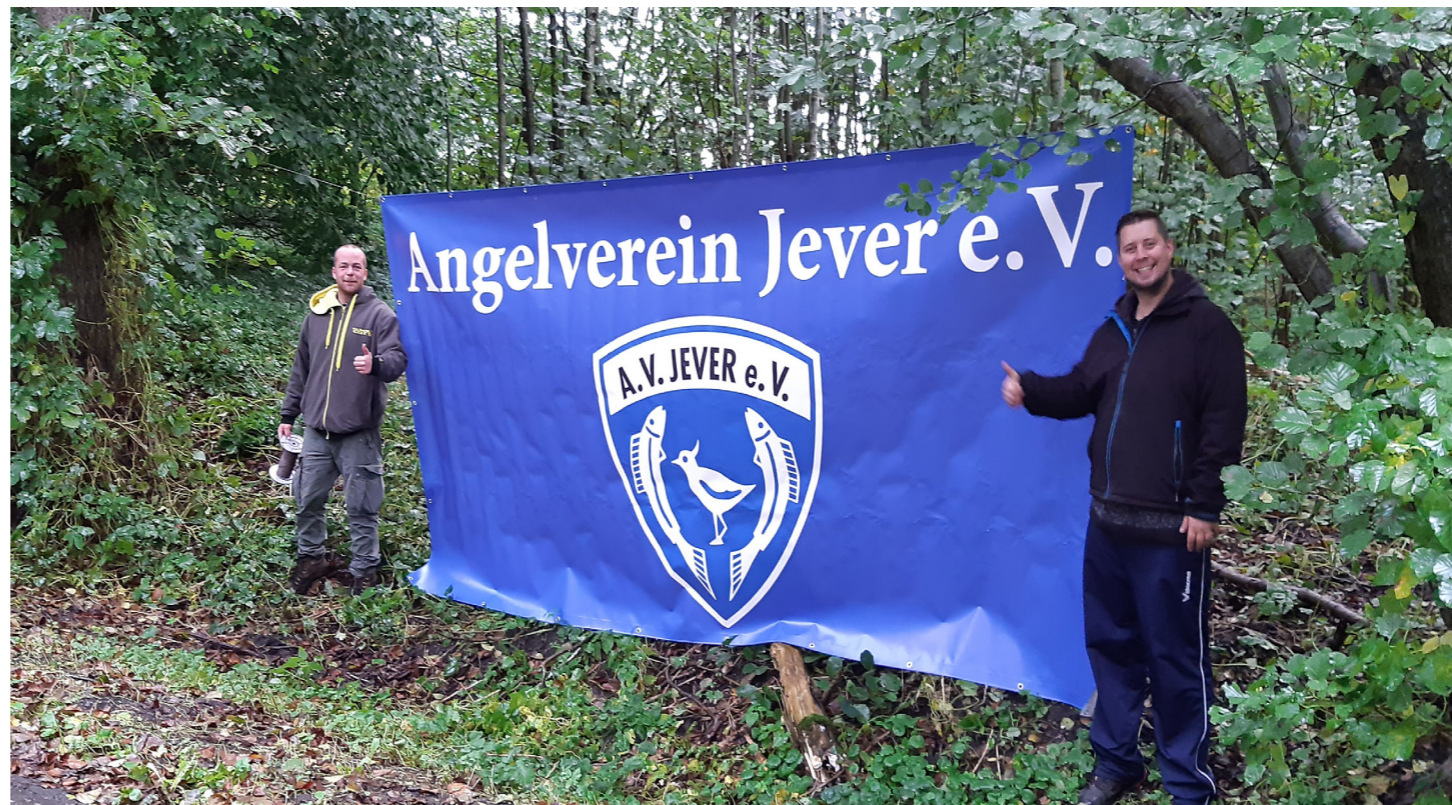
Links Die "Kleinen" ganz groß